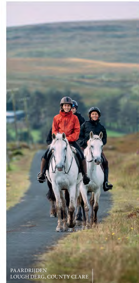
PAARDRIJDEN LOUGH DERG, COUNTY CLARE