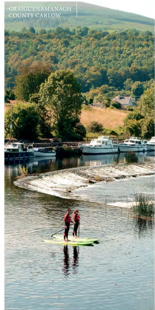
GRAIGUENAMANAGH COUNTY CARLOW