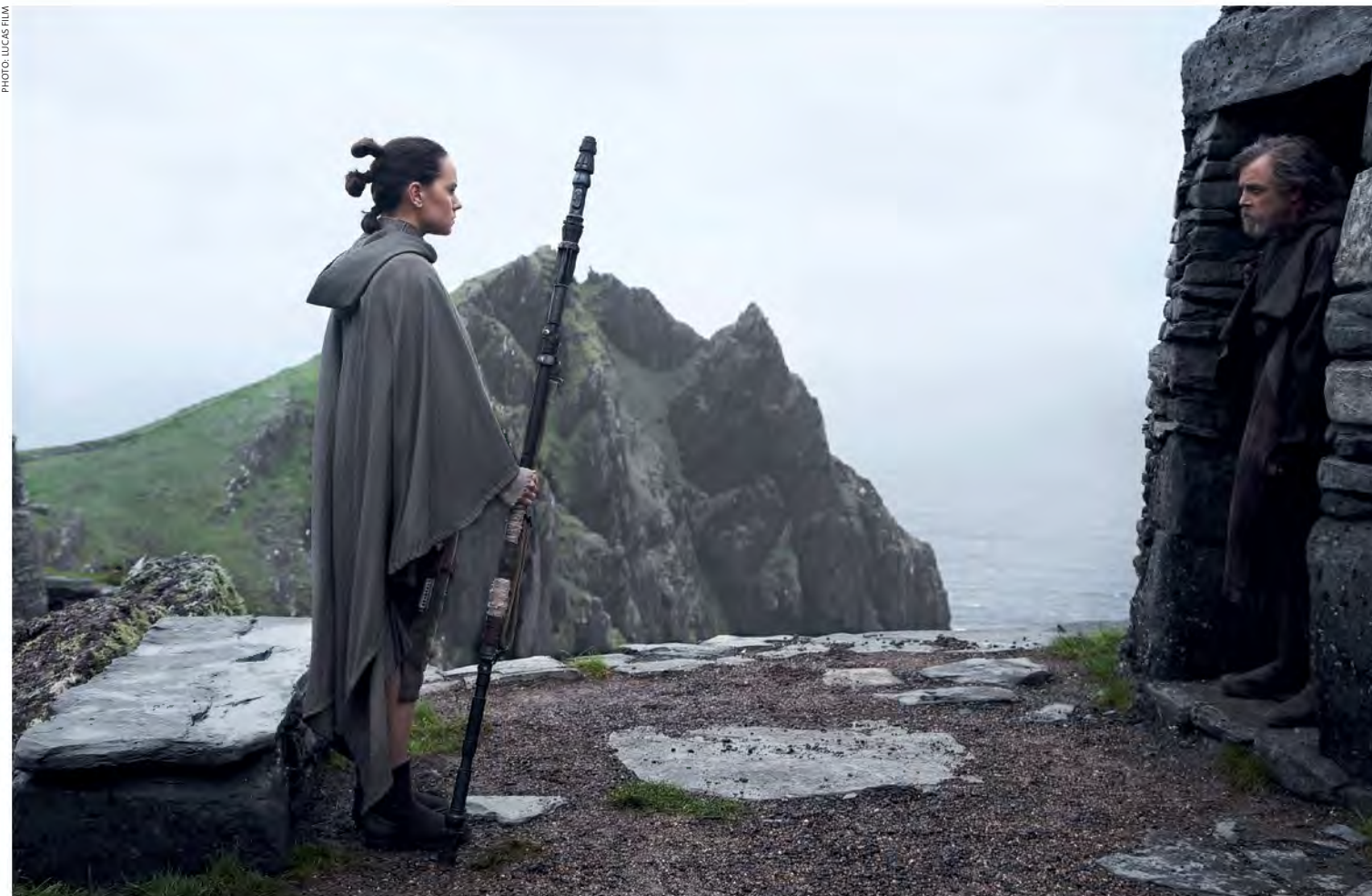
LUKE'S ISLAND WILD ATLANTIC WAY