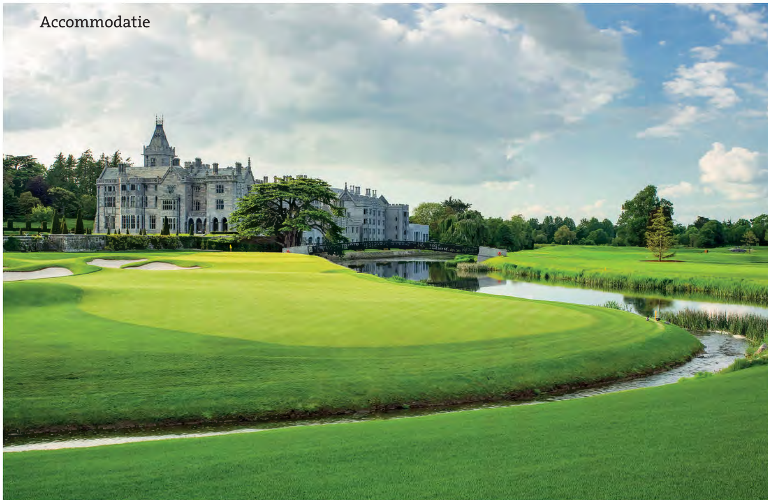
ADARE MANOR COUNTY LIMERICK