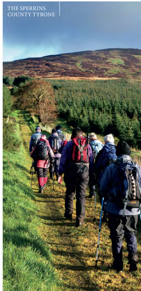
THE SPERRINS COUNTY TYRONE

Overal in Ierland op de Greenways ben je verzekerd van een makkelijke manier om indrukwekkende bezienswaardigheden te zien. Het ideale van de fiets is dat je altijd een zitplaats met goed zicht hebt. ♥