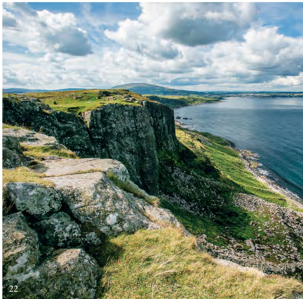
DRAGONSTONE KLIFFEN COUNTY ANTRIM

🗡️ MET EEN BONTMANTEL OM JE SCHOULDERS KUN JE LEREN BOOGSCHieten OF HET BIJWERPEN PROBEREN 🗡️